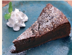
しっとりガトーショコラ カカオ58%使用の大人スイーツ