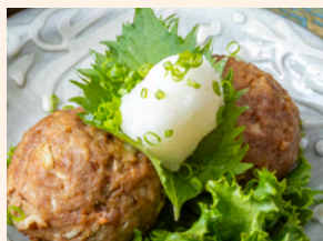
さっぱり和風しそおろし