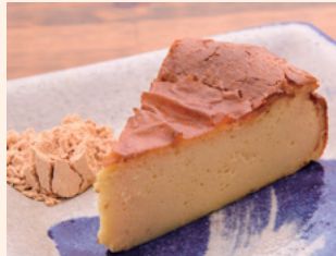
土〜夢チーズケーキ シークワーサーの酸味が爽やか