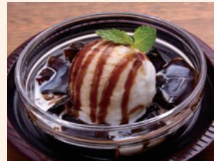
黒糖ミルク珈琲ゼリー ミルクと相性のいい珈琲豆使用