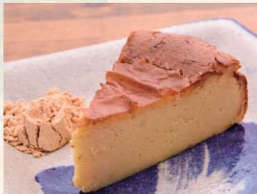
土〜夢チーズケーキ シークワサーの酸味が爽やか