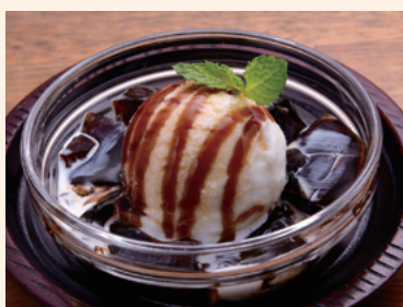
黒糖ミルク珈琲ゼリー ミルクと相性のいい珈琲豆使用