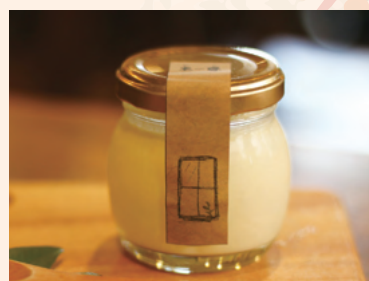
土〜夢の豆乳プリン とろける豆乳プリン県産卵使用