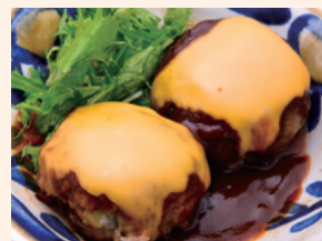
デミグラスチーズ