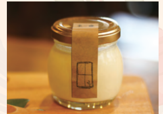
土〜夢の豆乳プリン とろける豆乳プリン県産卵使用