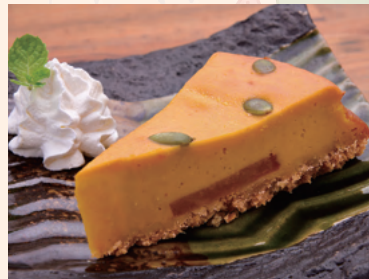
濃厚かぼちゃケーキ 北海道産栗かぼちゃ使用