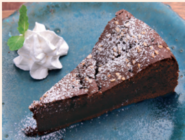
しっとりガトーショコラ カカオ58%使用の大人スイーツ