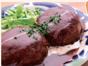
自家製デミグラスソース