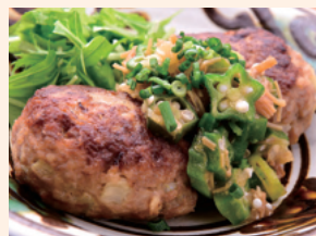
ネバネバ和風おろし