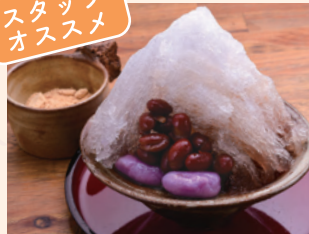
きび糖100%ぜんざい 自慢の自家製あずき きな粉と一緒に。 温 冷