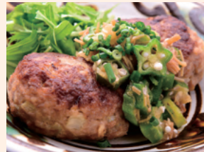
ネバネバ和風おろし