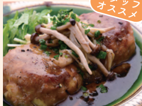
和風だしのきのこ餡かけ