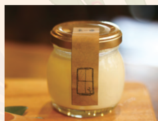
土〜夢の豆乳プリン とろける豆乳プリン県産卵使用