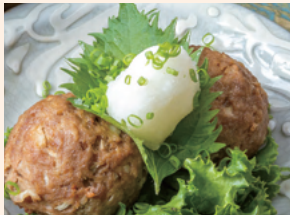
さっぱり和風しそおろし