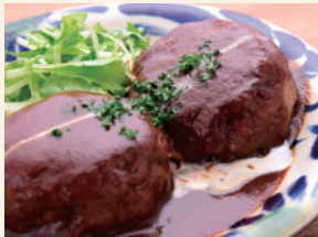
自家製デミグラスソース